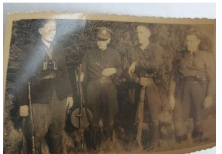
Bidone tarp kitų dokumentų rastos partizanų nuotraukos.