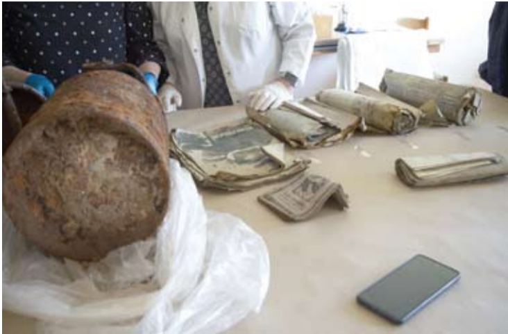
Taip atrodė atkastas bidonas su partizanų dokumentais.