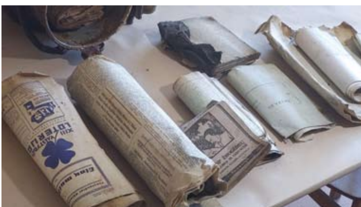
Šie partizanų dokumentai buvo sudėti į bidoną, rastą šalia Karčių kaimo.

Laisvės rajonui nuo 1949 metų pabaigos vadovavo Povilas Tun- kevičius-Kostantas, kartu ėjęs ir Šarūno rinktinės vado pareigas. Jis žuvo 1950 metų spalio 1 die- nį, kaudamasis su jį ir šešis kitus Laisvės rajono partizanus apsu- pusiais MGB kariškiais. Tikėtina, kad Laisvės rajono archyvą 1950 metų pavasario pabaigoje paslėpė